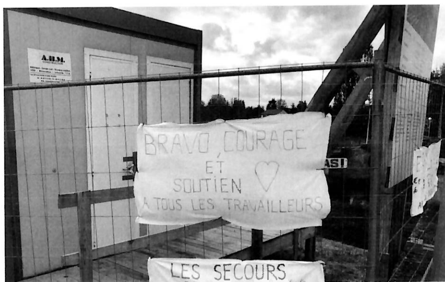
PV rédigé par Julien Biganzoli.

« Année gâchée ou année pour mieux redémarrer? »